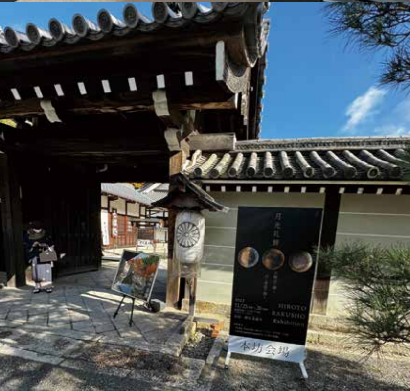
令和5(2023)年11月24~26日、皇室御香華院御寺泉涌寺にて、世界的金箔アーティストのヒロト・ラクショウ氏と共催した個展の様子。