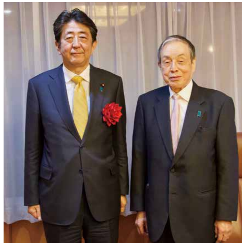
令和4（2022）年4月、日本経済人懇話会にて、安倍晋三氏と神谷光徳氏（日本経済人懇話会会長、「美しい国・日本を守る国民会議」発起人代表）。

私が会長を務める日本経済人懇話会でも、安倍総理には2度講演をしていただきました。最初は総理に返り咲かれる2年前で、若い会員が「もう一度、総理になつて